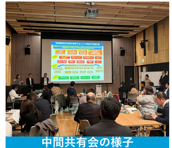
中間共有会の様子