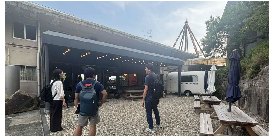
加古川市を中心に活動している、企業や自治体の方に話を聞いている様子