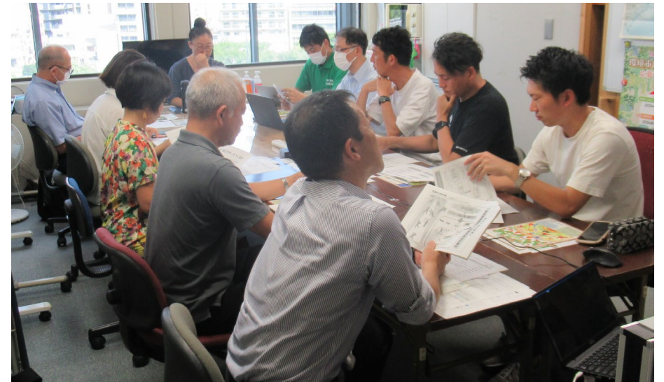
2024年度 対話の場づくりの様子